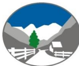
KRAJINSKI PARK LOGARSKA DOLINA